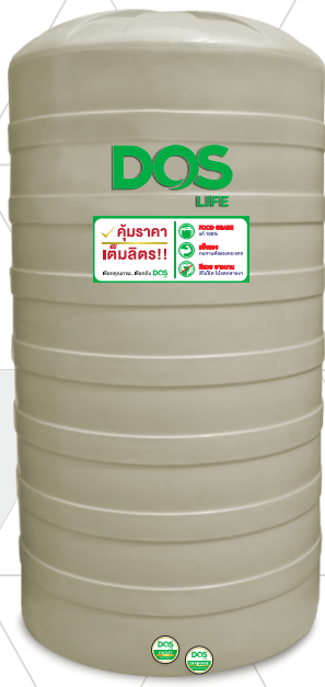
DOS PORCIO COM-02/CM COM-07/CM