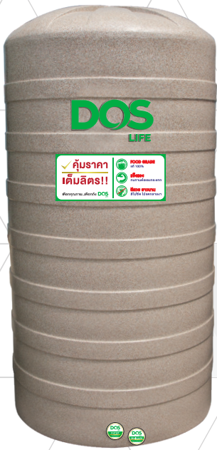
DOS GRANITO COM-01/SB