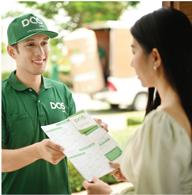
สินค้าจาดสิทริบิตริเป็นทีรียบร็อย