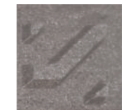
Black Sapphire แบล็ก แซฟไฟร์