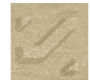
Harvest Gold ฮาร์เวสต์ โกลด์