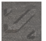
Super Black ซูเปอร์ แบล็ก