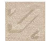
White Champagne ไวท์ แชมเปญ

* สีของผลิตภัณฑ์ อาจแตกต่างกันเล็กน้อย เนื่องจากการผลิต