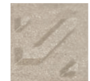
Pigeon Grey พิงจิ้น เกรย์